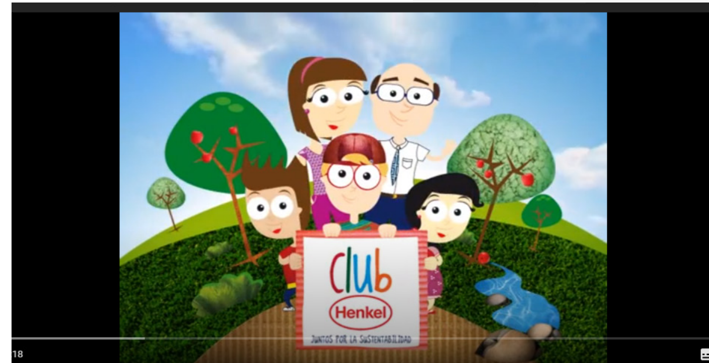
Obra de Teatro "El tiempo y los Henkel"