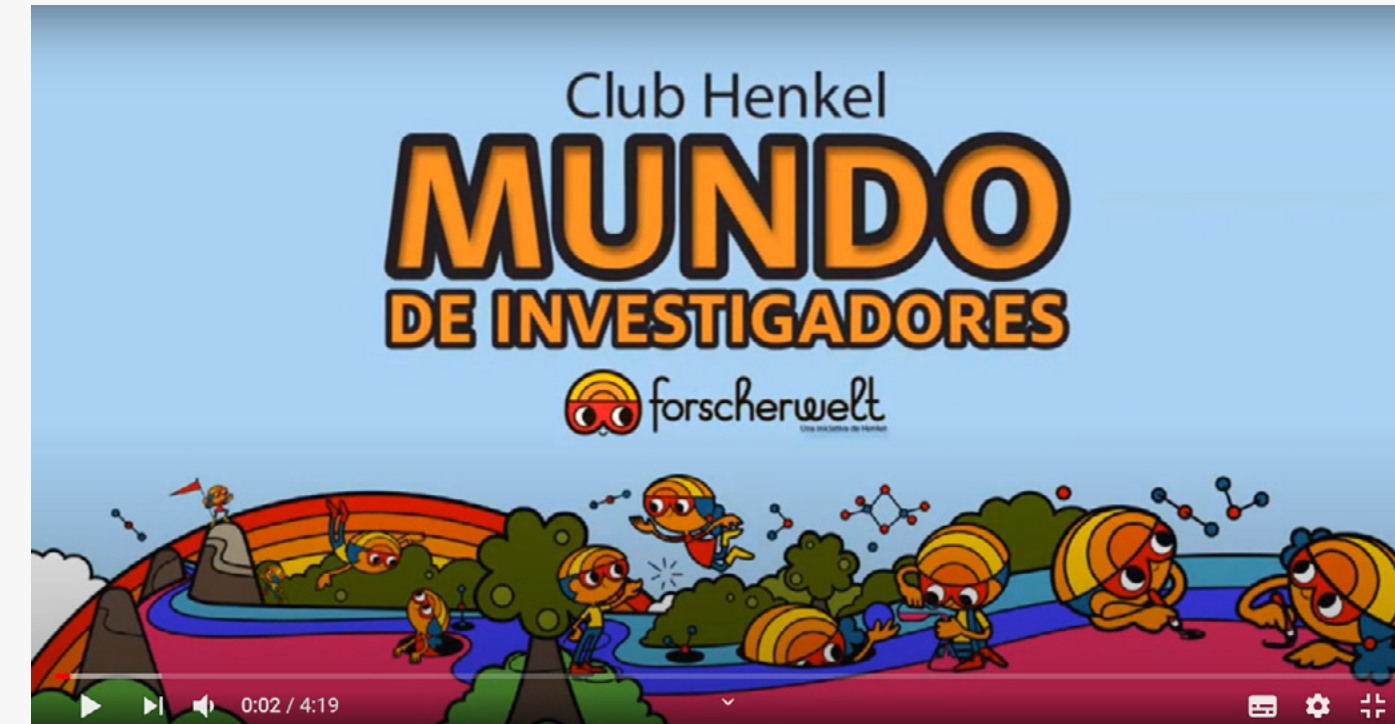
Talles de Ciencias "Forscherwelt"